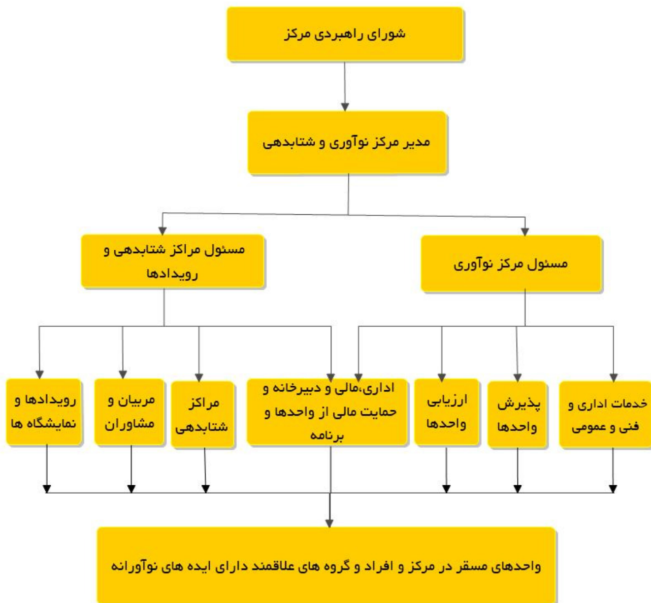
شکل ۱- ساختار سازمانی مرکز نوآوری و شتابدهی دانشگاه بیرجند

ماده ۹- ساختار سازمانی به شرح نمودار شکل شماره ۱ می باشد.