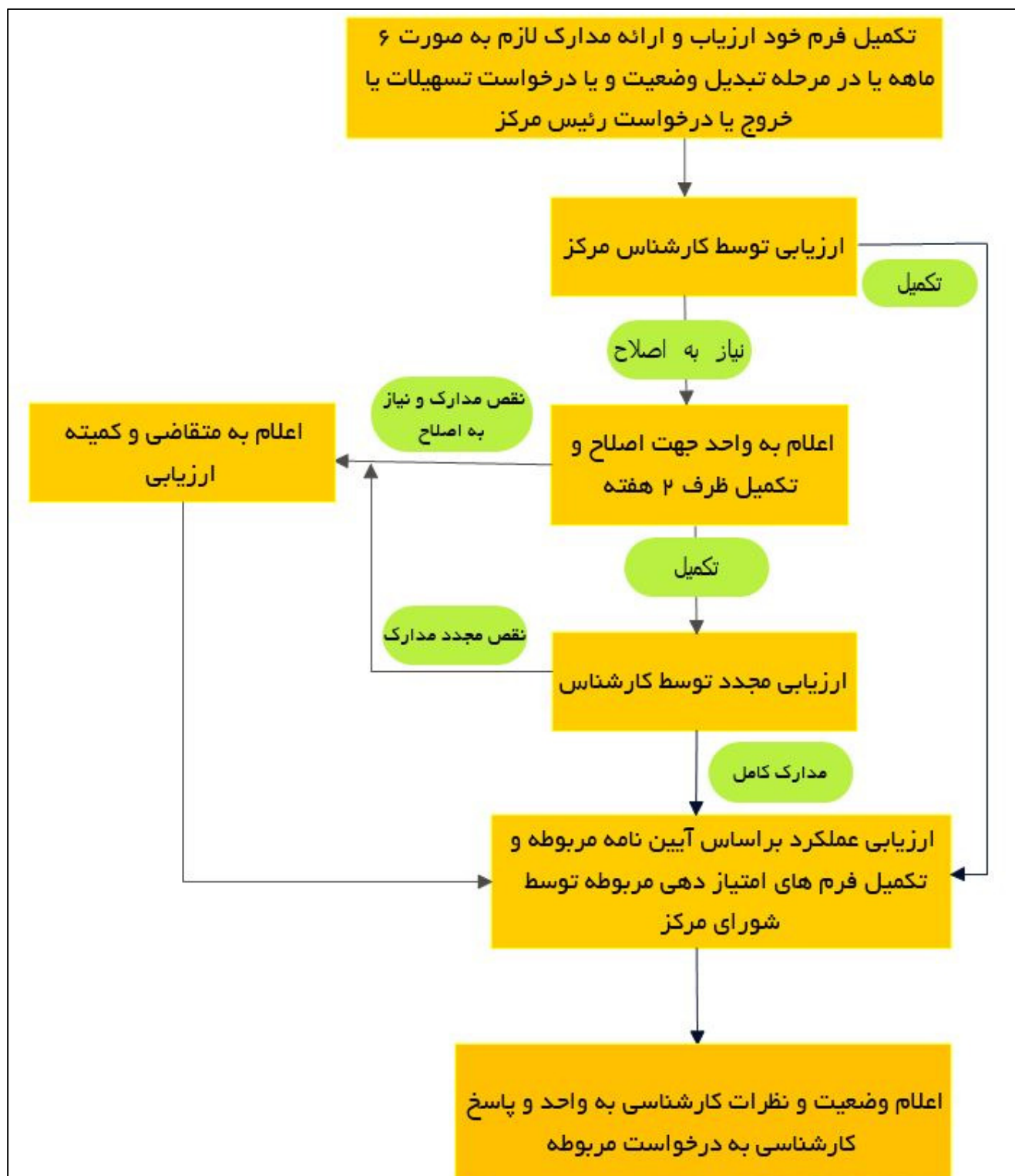
شکل ۳- گردش کار ارزیابی عملکرد گروه های مستقر در مرکز نوآوری دانشگاه بیرجند

ماده ۱۵- گردش کار مربوط به ارزیابی واحدهای مستقر در مرکز نوآوری دانشگاه به شرح نمودار شکل ۳ می باشد.